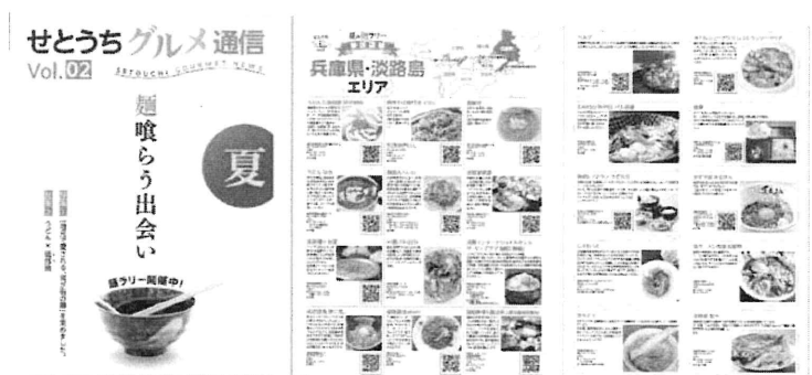
タブロイド誌「せとうちグルメ通信」（イメージ）