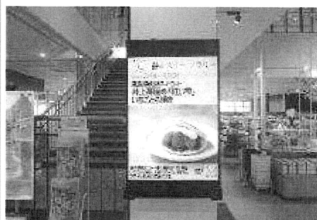
デジタルサイネージでの掲載イメージ