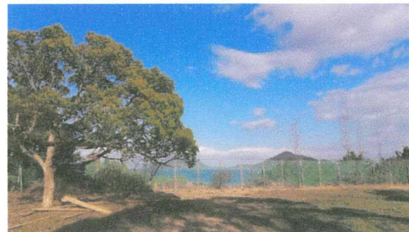
⑥ 八昭園（神社用地周辺）